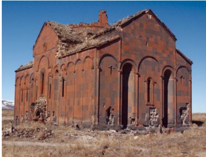
Անի. Մայր եկեղեցին