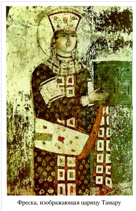
Фреска, изображающая царицу Тамару

Ансамбль монастыря Вардзиа был создан в основном в 1156—1205 гг., в правление Георгия III и его дочери царицы Тамары. Расположенный на юго-западной границе Грузии, монастырь-крепость перекрывал ущелье реки Куры для вторжения иранцев и турок с юга. В ту пору все помещения монастыря были скрыты скалой, с поверхностью их соединяли лишь три подземных хода, через которые крупные отряды воинов могли появиться совершенно неожиданно для неприятеля. В 1193—1195, во время войны с турками-сельджуками, царица Тамара находилась со своим двором в Вардзиа.