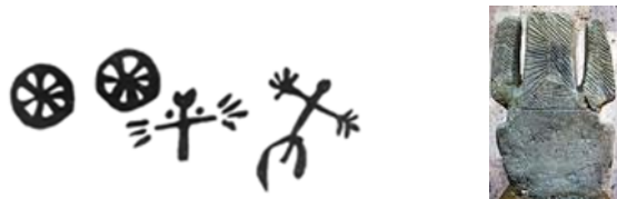
Ваагн - громовержец (наскальный рисунок) и каменный идол

связывают с переселением западных сино-тибетских племен на равнину в восточной части Китая. Учитывая то, что согласно раскопкам, большинство технологических нововведений приходили в долину Хуанхэ и Янцзы с запада, возникла идея о том, что Желтый император передал людям технологии. То есть, эти технологии были созданы не китайцами, а пришлыми, в данном случае, по версии автора, героями из Вана , из древнего дома Торгома . Вместе с технологиями они привнесли и древнее мировоззрение, фрагменты которого сохранились в мифах и преданиях, в частности в именах и подвигах, в образах китайских божеств, героев и правителей.