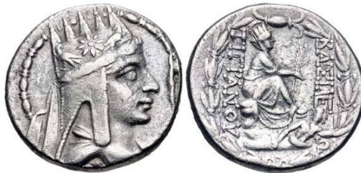
Рис. 1. Монета с изображением царя Тиграна Великого, правивший в 95-55 гг. до н. э. На головном уборе пять остроконечных зубцов, каждая символизирует отдельную страну/дом, в целом свидетельствует о его покровительстве над этими странами. Титул «царь царей» является символом высшей власти

Потомков Тираса , как замечает Иосиф Флавий, греки называют фракийцами; а во Фракии была река под названием, в которой сохранился след его имени 83 . Одрис, которому поклонялись фракийцы, совпадает с Тирасом , бога которого иногда называют Фраксом . Это одно из имен Марса, бога фракийцев. По мнению некоторых библейских комментаторов, потомки Тираса были отождествлены с Турсеноями , "которые совершали набеги по всему Эгейскому морю" и с Туршей ( Турушей или Терешем ), которые были зарегистрированы египетскими источниками во времена фараонов Мернептаха и Рамзеса II. Некоторые библейские комментаторы также предполагают возможную связь с городом Троя , известным на хеттском языке как Таруиса . Другие, включая Дэниела Г. Бринтона, предположили, что Тирас является прародителем коренных народов Америки (Источник: Tiras -Wikipedia).