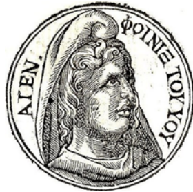
Рис. Портрет Фойника из сборника биографий - Promptuarii Iconum Insigniorum (1553 год) 57

мудрость, точно также как Кекропс из города Мемфиса привел жителей в Афины, который стал домом мудрости. Кекропс изобрел письмена для Греков, что другие приписывают Кадму».